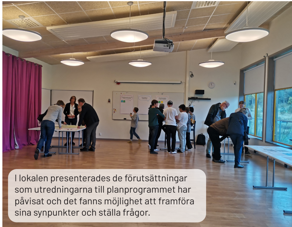
I lokalen presenterades de förutsättningar som utredningarna till planprogrammet har påvisat och det fanns möjlighet att framföra sina synpunkter och ställa frågor.